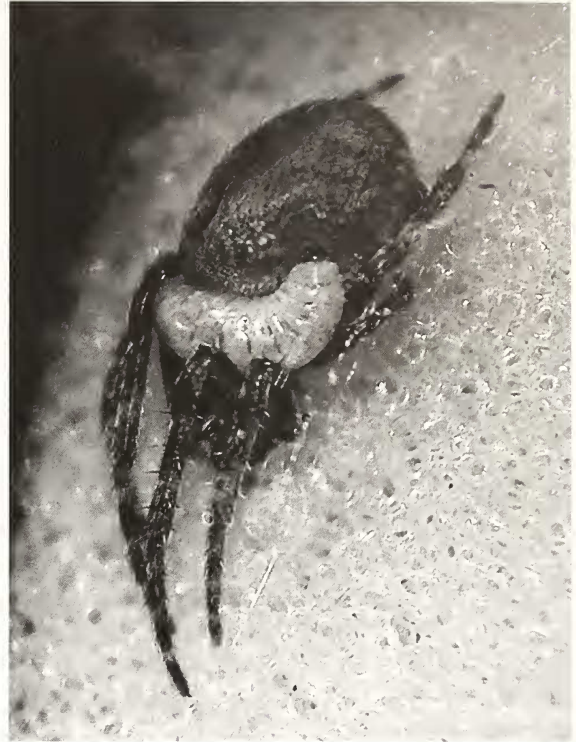
Abb. 2: Brückenspinne mit Wespenlarve kurz vor dem Ende der Larvalentwicklung (im Terrarium)

Die Erforschung der Spinnenparasitoiden unter den Schlupfwespen (Ichneumonidae), die zum Polysphincta -Gattungskomplex